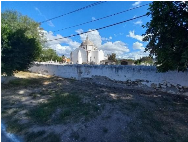
Imagen 2, Daños en Barda Perimetral Capilla del Señor de Chalma.

Catálogo de Daños: Se creó un catálogo que clasifica los daños según su gravedad, impacto estructural y localización en el edificio. Este catálogo servirá como base para la planificación de las intervenciones necesarias, como puede verse en la imagen 3.