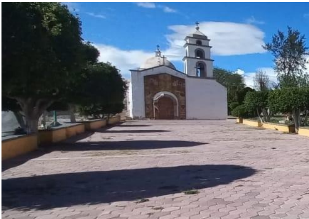
Imagen 1. Portada de Capilla del Señor de Chalma.