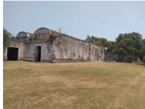
Imagen 1. Daños y deterioros encontrados en la ex hacienda. Fuente: Elaboración propia.

algunas cubiertas aún existen, de ellas resaltan las bóvedas de cañón de las 2 trojes, cuyas dimensiones son de más de treinta metros de largo por siete de ancho y con muros de 1.30 metros de ancho (imágenes 1-3).