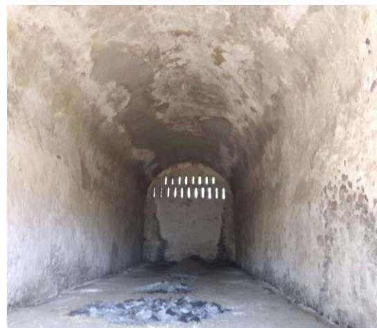
Imagen 2. Daños y deterioros encontrados en la ex hacienda.