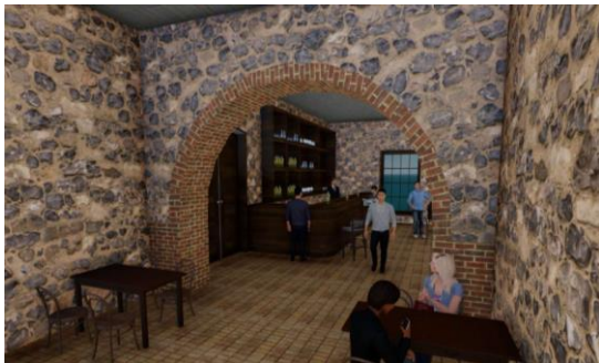
Imagen 7. Restaurante-Bar, proyecto de reutilización de la ex hacienda de Tenguendhó.