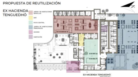
Imagen 5. Proyecto de reutilización de la ex hacienda de Tenguendhó. Fuente: elaboración propia.