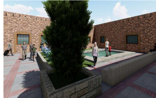
Imagen 8. Patio central, proyecto de reutilización de la ex hacienda de Tenguendhó.