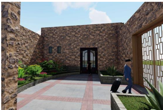
Imagen 6. Plaza de acceso, proyecto del proyecto de reutilización de la ex hacienda de Tenguendhó.