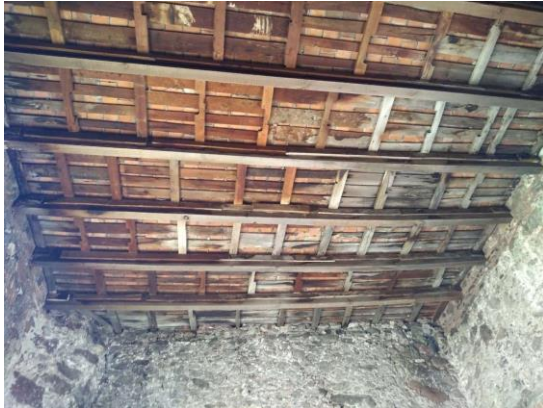
Imagen 3. Daños y deterioros encontrados en la ex hacienda.