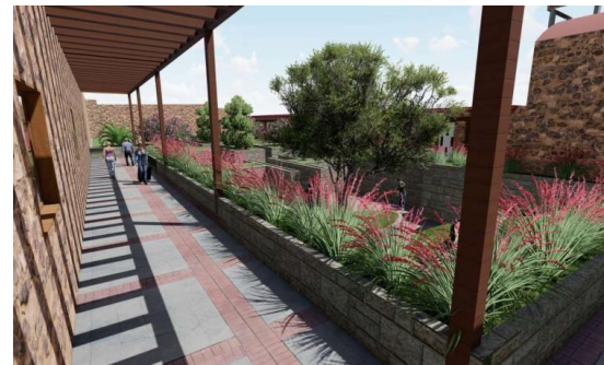
Imagen 9. Jardín de habitaciones sencillas, proyecto de reutilización de la ex hacienda de Tenguendhó.